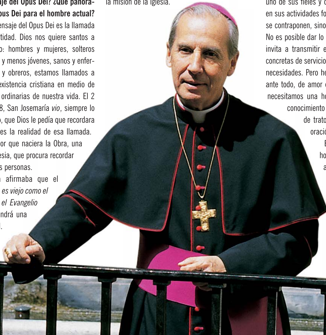
Mons. Javier Echevarría

El Opus Dei ayuda a mujeres y hombres a conducirse conforme a su fe cristiana en la actividad diaria; y les ofrece la atención espiritual y la formación oportunas. A partir de ahí, el apostolado principal del Opus Dei se traduce en el que