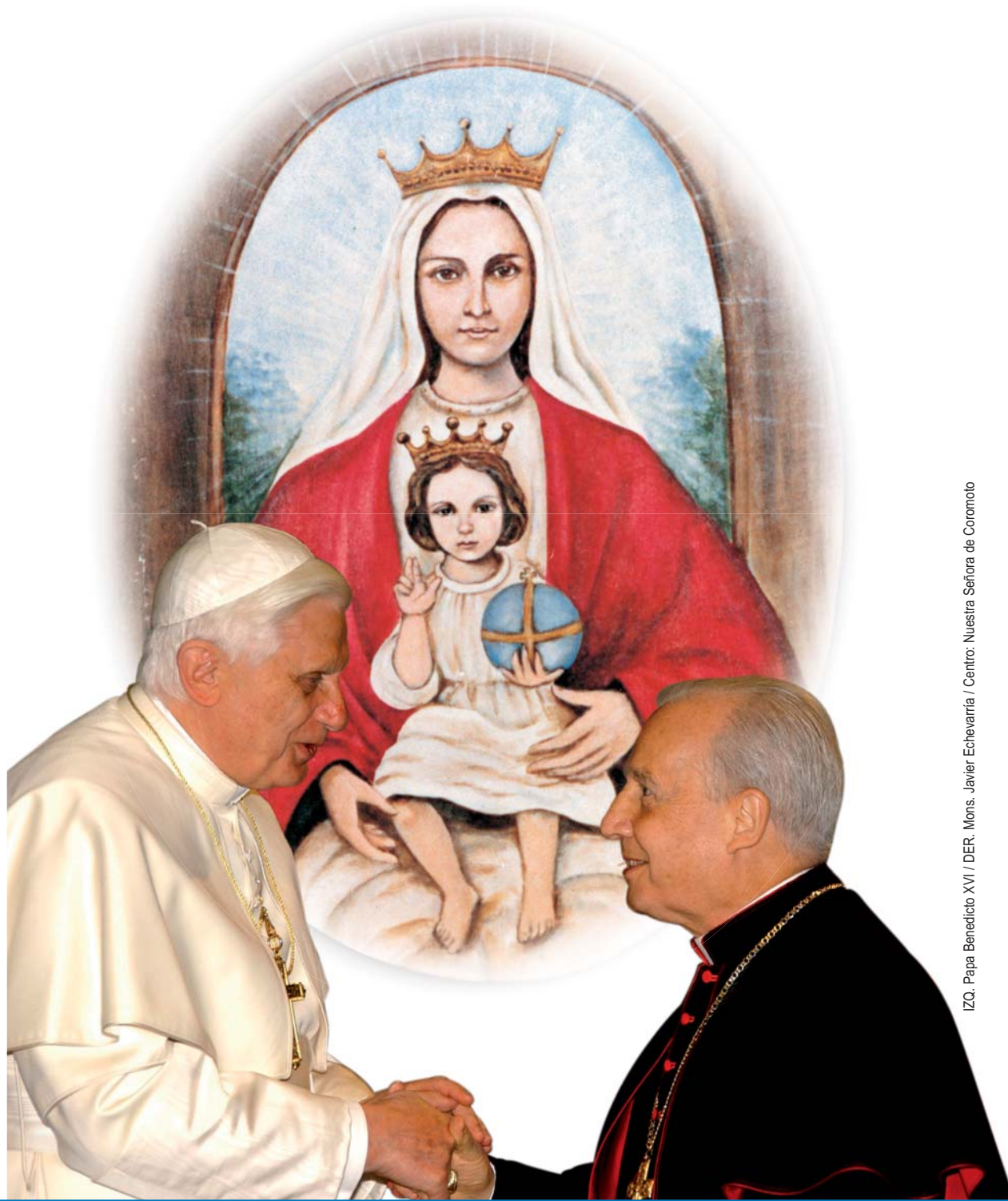
IZQ. Papa Benedicto XVI / DER. Mons. Javier Echevarría / Centro: Nuestra Señora de Coromoto

lo que dijo nuestro Fundador en un encuentro que tuvo con muchas personas en 1975, pocos meses antes de su fallecimiento. Alguien le preguntó qué esperaba de Venezuela, y contestó: Yo espero de esta nación tan grande, tan grande, tan grande, que tiene un presente hermoso, y un porvenir lleno de bendiciones de Dios, que sea cada día más cristiana. Más cristiana en la cabeza de las gentes, en la fe, en las costumbres, en el modo de vivir, en el modo de obrar, en el modo de quererse unos a otros, en el modo de contribuir a la paz del mundo. Pido a Dios que este deseo y esta esperanza de San Josemaría se hagan realidad. Me dirijo a Nuestra Señora de Coromoto, para que continúe protegiendo a esta tierra suya, y llene de bendiciones a su Iglesia que peregrina en Venezuela y a todos los hombres y mujeres, sean o no católicos, de este gran país.