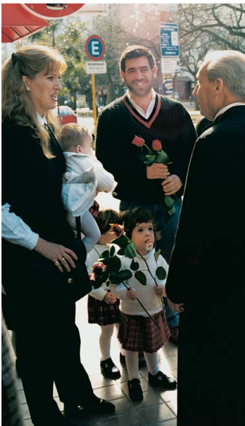
Mons. Javier Echevarría comparte con un grupo familiar

Como afirmaba también ese santo sacerdote, lo que se necesita para conseguir la felicidad, no es una vida cómoda, sino un corazón enamorado (Surco, n. 795) . Y el amor se prueba en el sacrificio, en la capacidad de olvidarse de uno mismo para entregarse al prójimo. El hombre y la mujer, creados el uno para el otro, han de descubrir su vocación al amor y comprender que, si desean cumplir bien su altísima tarea, deben prepararse y rezar mucho. La felicidad matrimonial se construye cada día, con detalles de servicio y de cariño, aprendiendo a perdonar y a pedir perdón, a comprender, a amar.