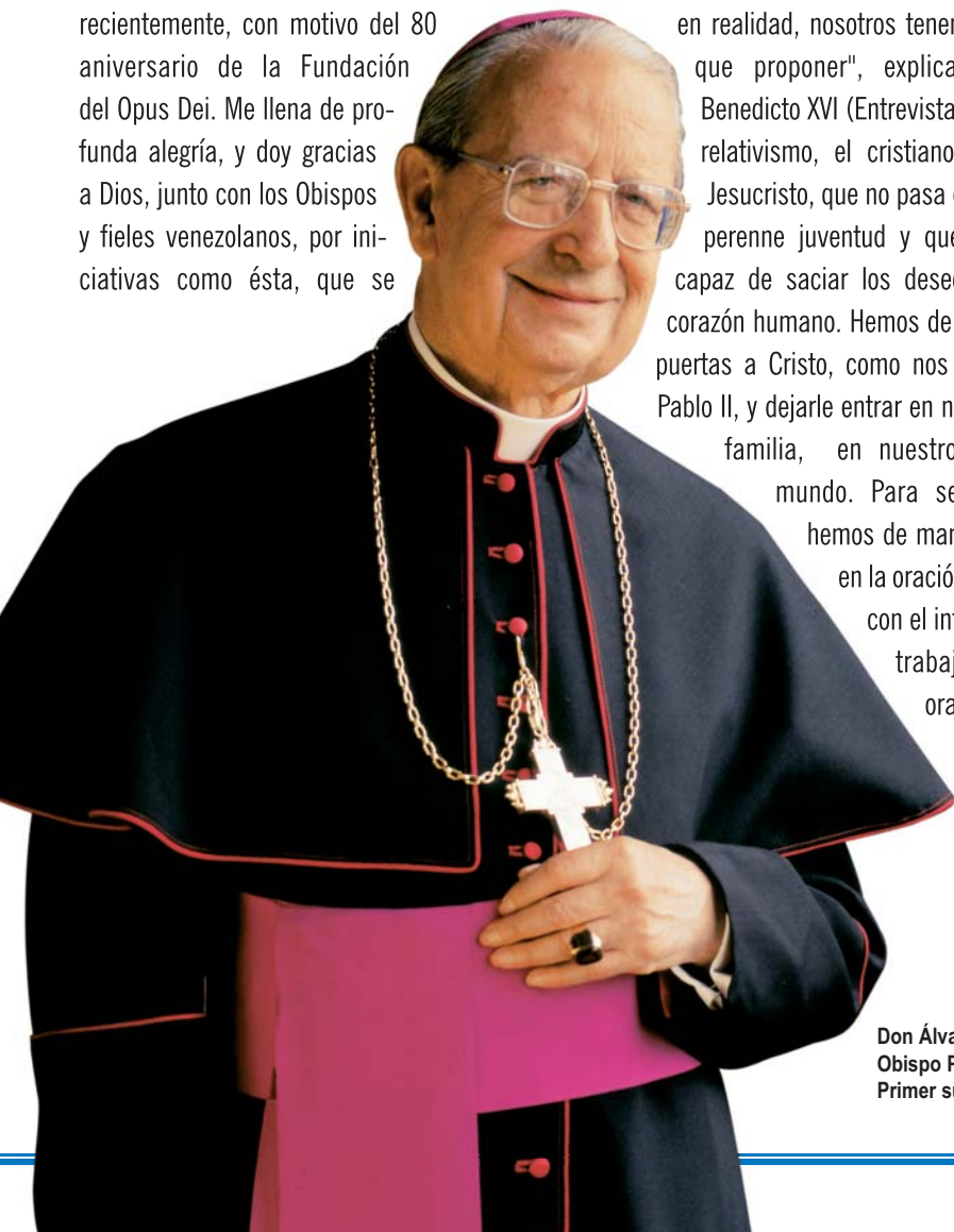
Don Álvaro del Portillo, Obispo Prelado del Opus Dei. Primer sucesor de San Josemaría

Los ejemplos son numerosísimos. No faltan, desde luego, en Venezuela. He tenido la oportunidad de conocer personalmente algunas de estas iniciativas cuando estuve allí en el año 2001. Recuerdo, por ejemplo, la labor de promoción de la mujer que realizan desde el Instituto Kasanay, en las afueras de Maracaibo; también pude visitar la Universidad Monteávila, en Caracas, que en esos momentos daba sus primeros pasos y que, como toda labor universitaria, intenta prestar un servicio importantísimo para la sociedad. También he seguido de cerca todo el trabajo que se realiza desde la Parroquia de la Sagrada Familia de Nazaret y San Josemaría Escrivá de Balaguer. Por ejemplo, la síntesis del Catecismo que se distribuyó recientemente, con motivo del 80 aniversario de la Fundación del Opus Dei. Me llena de profunda alegría, y doy gracias a Dios, junto con los Obispos y fieles venezolanos, por iniciativas como ésta, que se